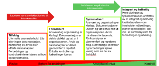
Modenhetsanalyse internkontroll – Agder fylkeskommune