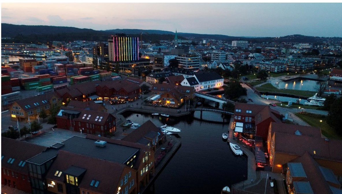
Bilde fra Lagmannsholmen, cruisekaia, Gravane, Kilden og Fiskebrygga.

https://www.ks.no/globalassets/fagomrade/r/forskning-og-utvikling/storbyforskning/Programnotat-2020-2023.pdf