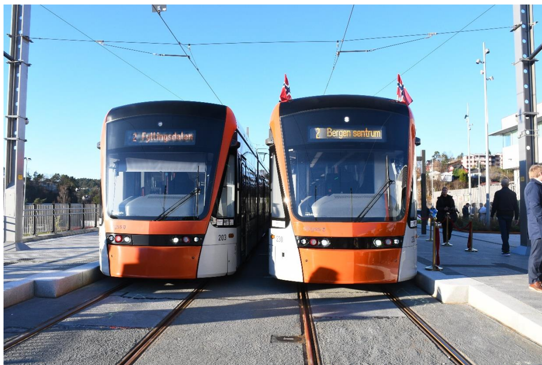
Bybanen fra Byparken i Bergen til Fyllingsdalen terminal, åpnet i 2022.

I 2022 har det både vært digitale og fysiske møter i programstyret.