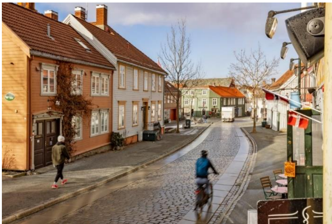
Bakklandet, Trondheim.

Det pågående prosjektet Storbyenes rolle i generalistkommunesystemet utarbeidet en underveisrapport høsten 2022. KS storbynettverk oversendte underveisrapporten til det regjeringsoppnevnte "Generalistkommuneutvalget" i oktober 2022, som et felles innspill fra storbyene til utarbeidelse av NOU om vurderinger av dagens generalistkommunesystem