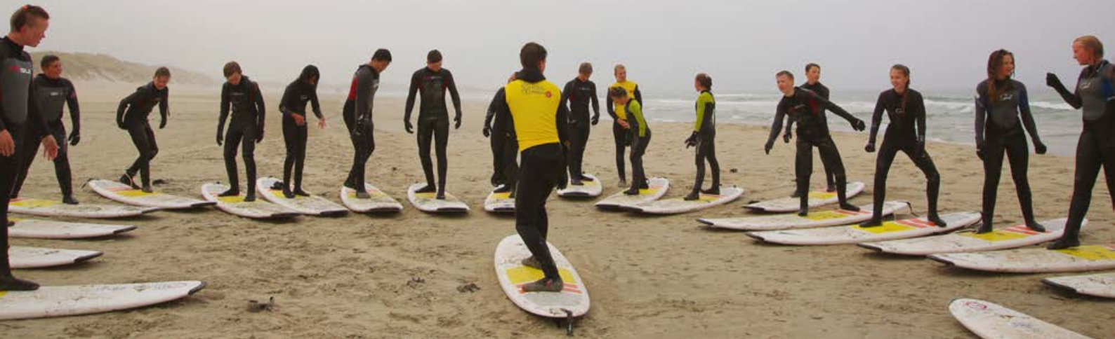
SURFEKURS: Surfekurs i regi av Fiks Ferigge Ferie.