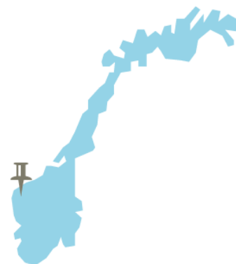
2. Eid, Sogn og Fjordane

Skoleåret 2017/2018 var det tolv kombinasjonsklasser ved til sammen åtte videregående skoler i Sogn og Fjordane. Til sammen deltok 113 elever i tilbudet. I Sogn og Fjordane kalles tilbudet Grunnskoleopplæring for minoritetsspråklig ungdom (GMU). Følgende skoler i Sogn og Fjordane hadde GMU-klasser skoleåret 2017/2018: