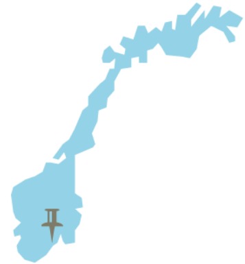
5. Porsgrunn, Telemark

I Telemark tilbys kombinasjonsklasser hvor elevene får grunnskoleopplæring på en videregående skole. Fylkeskommunen har, sammen med samarbeidende kommuner, utarbeidet et felles konsept for kombinasjonsklasser som alle samarbeidskommunene og skolene følger. I skoleåret 2017/2018 var det seks kombinasjonsklasser med til sammen 90 elever fordelt på fire videregående skoler i Telemark: