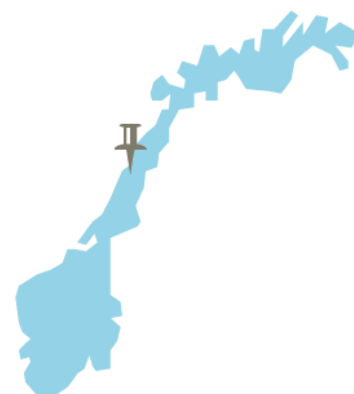
4. Mosjøen, Nordland

Nordland fylkeskommune har opprettet kombinasjonsklasser gjennom et prosjekt med tilskuddsmidler fra IMDi og Jobbsjansen del B. Fylkeskommunen samarbeider med tre kommuner som har opprettet kombinasjonsklasser ved hver sin videregående skole, og hvor elever fra både kommunen og fylkeskommunen får grunnskoleopplæring. Til sammen gikk 58 elever i kombinasjonsklasse i Nordland skoleåret 2017/2018. Per juni 2018 fantes det kombinasjonsklasser på følgende skoler: