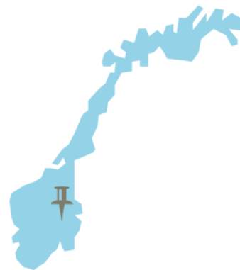
3. Hamar, Hedmark

Hamar katedralskole er en av to videregående skoler med kombinasjonsklasser i Hedmark fylkeskommune, hvor til sammen 65 elever fikk tilrettelagt grunnskoleopplæring på videregående i skoleåret 2017/2018. Hamar katedralskole har 50 av disse elevene. Her kalles tilbudet «innføringsklasse med grunnskole». Det er også en kombinasjonsklasse med 15 elever ved Nord-Østerdal videregående skole i Tynset kommune. Tilbudet på de to skolene har ulik historikk, noe som har resultert i ulike organiserings- og finansieringsmodeller. Disse forskjellene redegjøres for underveis i casebeskrivelsen.