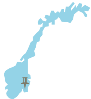
1. Askim, Østfold

I Østfold tilbys kombinasjonsklasser hvor elevene får grunnskoleopplæring på en videregående skole. Fylkeskommunen har utarbeidet en modell for klassene og samarbeidet med kommunene. I tillegg til Askim kommune, inngår kommunene Sarpsborg (Greåker vgs., to klasser) og Moss (Malakoff vgs., to klasser) i samarbeidet. Til sammen var det 6 kombinasjonsklasser med ca. 90 elever totalt i kombinasjonsklassene på de tre skolene i skoleåret 2017/2018. Elever fra nabokommunene kan søke seg til tilbudet. Fra høsten 2018/2019 ble det i tillegg opprettet to klasser på Fredrikstad vgs. Dette tilbudet er imidlertid beskrevet i de følgende avsnittene, da datainnsamlingen ble gjennomført på et tidspunkt da dette tilbudet ikke var etablert.