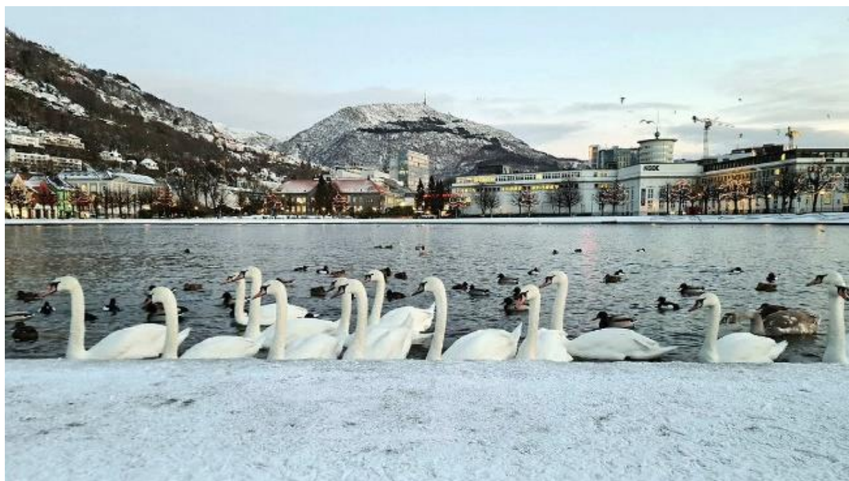
«Svaner i Lille Lungegårdsvann».

https://www.ks.no/globalassets/fagomrade/r/forskning-og-utvikling/storbyforskning/Programnotat-2020-2023.pdf