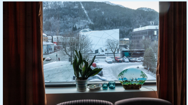
UTSIKT TIL KULTUR: Fra fellesrommet er det utsikt til Førde Kunstmuseum, som er det hvite bygget på bildet.

– Vi hadde tett dialog helt fra start, sier hun.