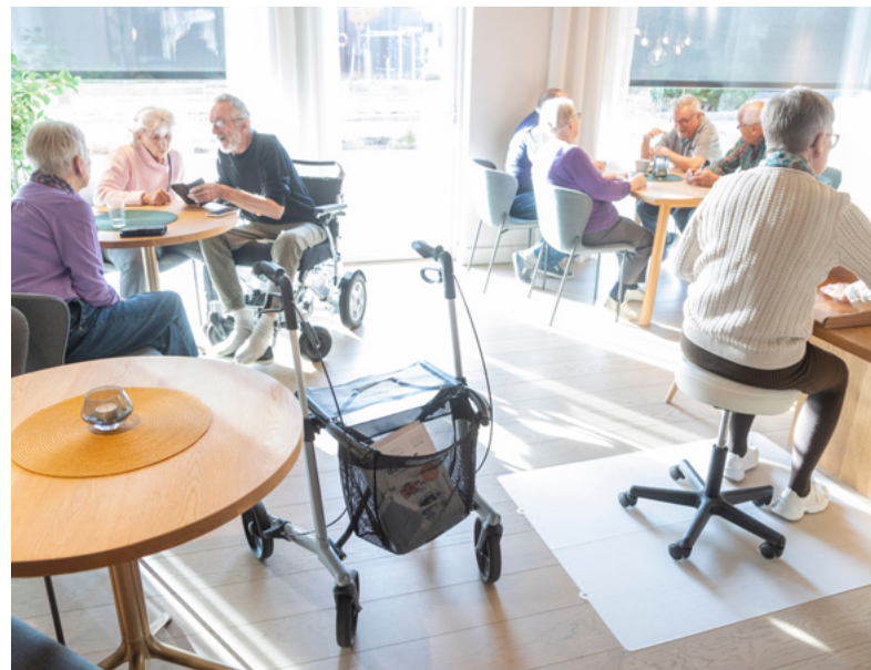
MANGE SONER: Langbord, lenestoler og små og store sittegrupper preger fellesrommet. Det gir rom for mange typer samvær.