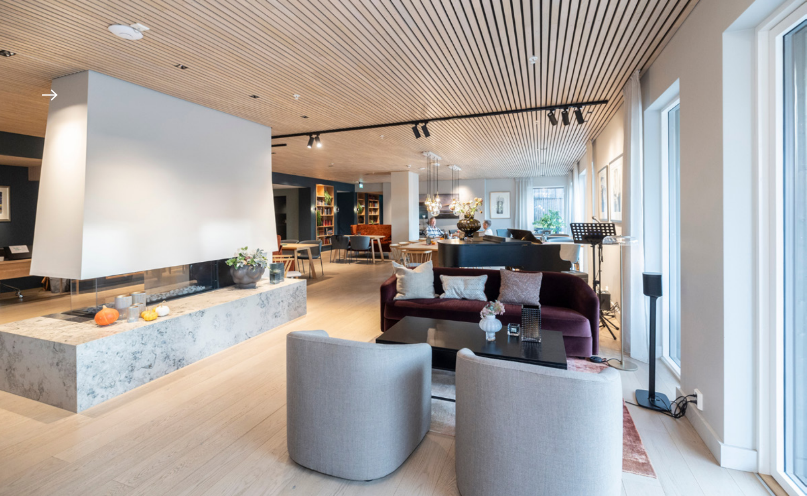
VELKOMMEN: Oppholdsrommet er påkostet, ligger sentralt og har plass for mange ulike aktiviteter.