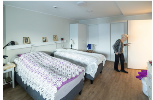
STORT SOVEROM: Soverommet er bygget stort, slik at et eventuelt fremtidig pleiebehov enkelt kan ivaretas.

– Det beste rådet må være å bruke sunn fornuft, og tenke som så at hvis man ikke makter å gjøre det som skal gjøres, så må andre overta det. Da må en få seg et enklere sted å bo. ●