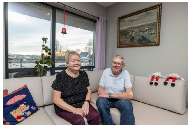
MANGE FORDELER: De var primært på utkikk etter en lettstelt leilighet. På kjøpet fikk de også et sosialt nettverk.

– Men huset var på to fulle etasjer, og på slutten brukte vi egentlig bare hovedetasjen, forklarer samboerne.