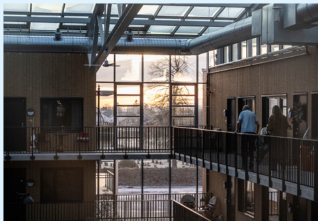
VENDT MOT HAGEN: Alle inngangsdørene er vendt mot vinterhagen.

– Bovieran har en god beliggenhet med tilgang på viktige funksjoner i nærmiljøet, som apotek og butikk, og er bygget i et mangfoldig lokalsamfunn. I et folkehelseperspektiv er det veldig viktig at du har tilgang på møteplasser. Det gjelder selvsagt når du er funksjonsfrisk, men nærhet til andre mennesker kan bli særlig viktig når helse begynner å svikte. Slik nærhet har du i et konsept som dette. ●