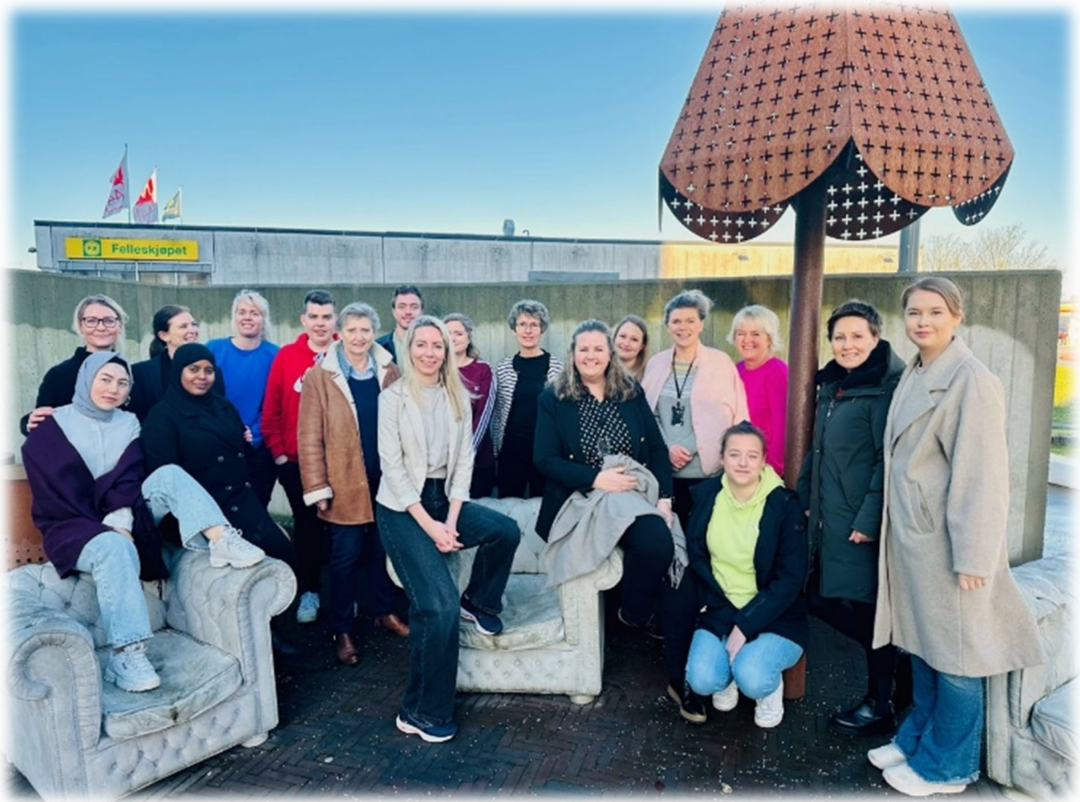
Deltakere utviklingsverksted i Time kommune

Andre samling fant sted den 26. januar 2023 ved Bryne Mølle og ble arrangert av Time kommune.