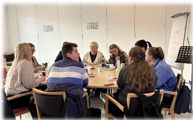
Gruppearbeid i Time kommune med studenter