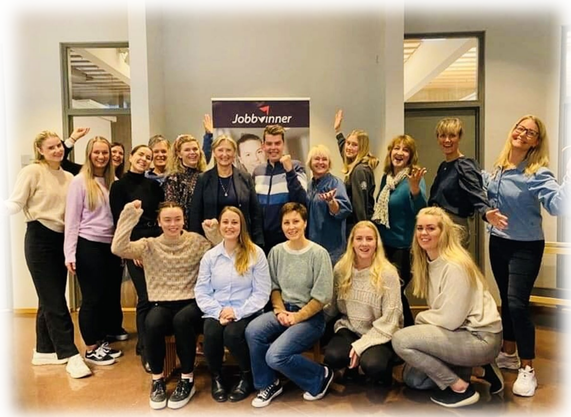
Deltakere på første utviklingsverksted; Klepp og Time kommune, 2.års studenter fra UiS, prosjektleder UiS, Nsf Rogaland og Jobbvinner.

Første samling fant sted den 26. oktober 2022 ved Arkeologisk museum i Stavanger. Dette arrangementet ble organisert av KS (Kommunesektorens organisasjon) og Universitetet i Stavanger.