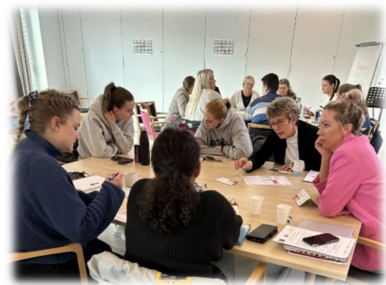
Gruppearbeid i Klepp kommune med studenter