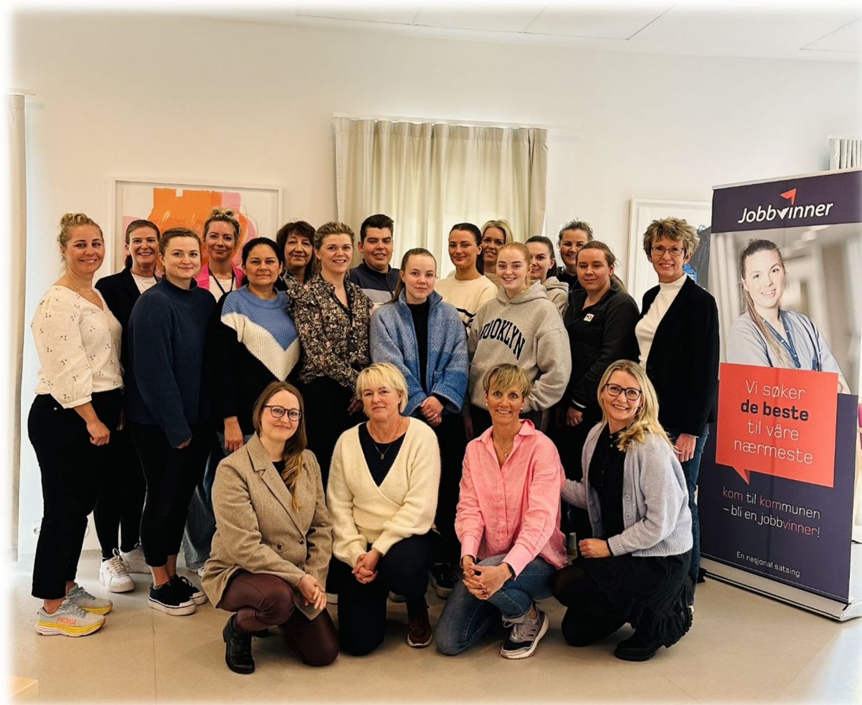
Deltakere utviklingsverksted Klepp kommune

Tredje samling fant sted den 12. april 2023 ved Sirkelen og ble arrangert av Klepp kommune.