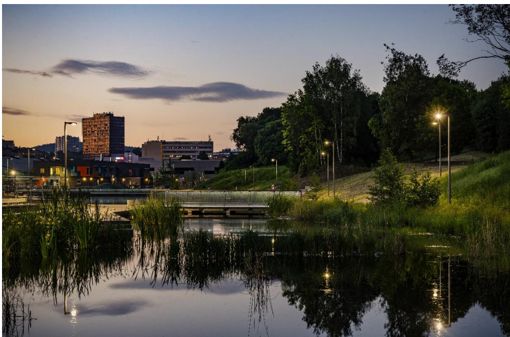
Teglverksdammen, Oslo.

I 2023 har det både vært digitale og fysiske møter i programstyret. I forbindelse med arbeid med nytt programnotat var programstyret i tillegg på studietur til Aarhus.