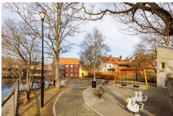
Gåsaparken, Trondheim.

Flere boliger og mer stabile bomiljøer i Trondheims sentrale bydeler er viktig for å oppnå målet om en bærekraftig by der det er lett å leve miljøvennlig. I den forbindelse er det avgjørende å tilrettelegge sentrumsområdene slik at det blir attraktivt å leve der også for barnefamilier. I dette prosjektet har målsettingen vært å identifisere forutsetningene for å skape gode oppvekstmiljøer for barn, hvilke verktøy og virkemidler som må til for å gjøre det attraktivt for barnefamilier å bosette seg og bli boende i sentrumsområdene også når barna blir større, og hvilke tiltak kommunen må gjennomføre for at byen kan bli et attraktivt sted å bo gjennom flere livsfaser.