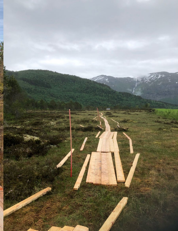
Surnadalskloppa - byggesett