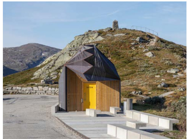
DO MED UTSIKT: Do på Sognefjellet med utsikt blant annet mot Hurrungane.