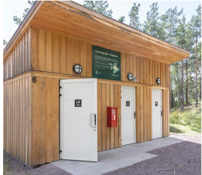
FLERE ANLEGG: På Langøyene utenfor Oslo er det flere nye toalettanlegg.