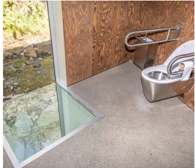
VED SKJERVFSOSSEN: Toalett ved populært turområde.

→ – Vi var opptatt av å ha stor geografisk spredning og de vi intervjuet representerer ulike landsdeler: Oslo, Vestland, Rogaland, Trøndelag, Viken, Nordland, Agder og Innlandet. Vi fant ut at det er like dårlig tilbud over hele landet, sier hun.