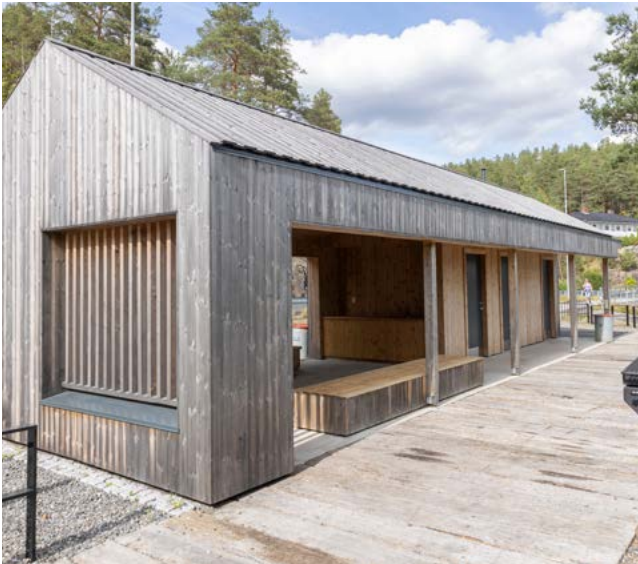
UNIVERSELT UTFORMET: Telemark har satset stort på turveier, og underveis ligger dette toalettanlegget.