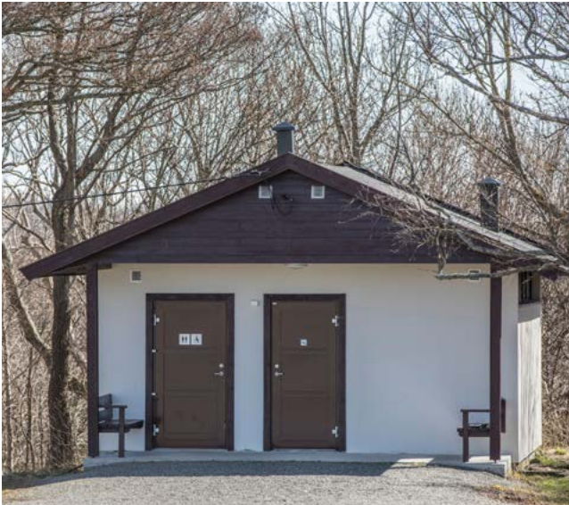
I FARTA: Doer rett ved tursti langs kysten i Stavern.