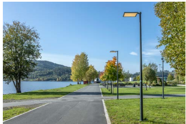
LYSER OPP: Alle gangveier er opplyst. Gress, kantstein og asfalt skaper kontraster som gjør orienteringen enklere.

– Det har hele tiden vært jobbet etter en helhetlig plan, der Mjøsparken har vært et avgjørende grep for å bygge attraktivitet og tilskynde vekst. Området er planlagt og utviklet som en del av en helhet, i tett samspill med andre store prosjekter, forklarer byutvikleren og nevner boligutvikling, kontorarbeidsplasser, Mjostårnet, hotell, utvidet båthavn, utbygging av firefelts E6, integrert rasteplass – og det nyåpnede amfiet som er bygget som støyskjerm ut mot E6.