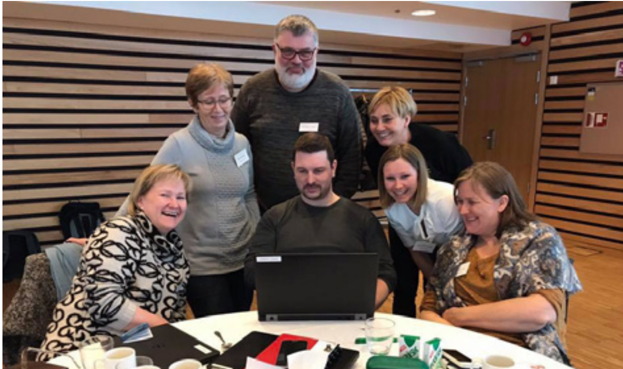
Foto fra Etikk, kvalitet og ledelse konferansen i Tromsø. Harstad kommune i etisk refleksjon.