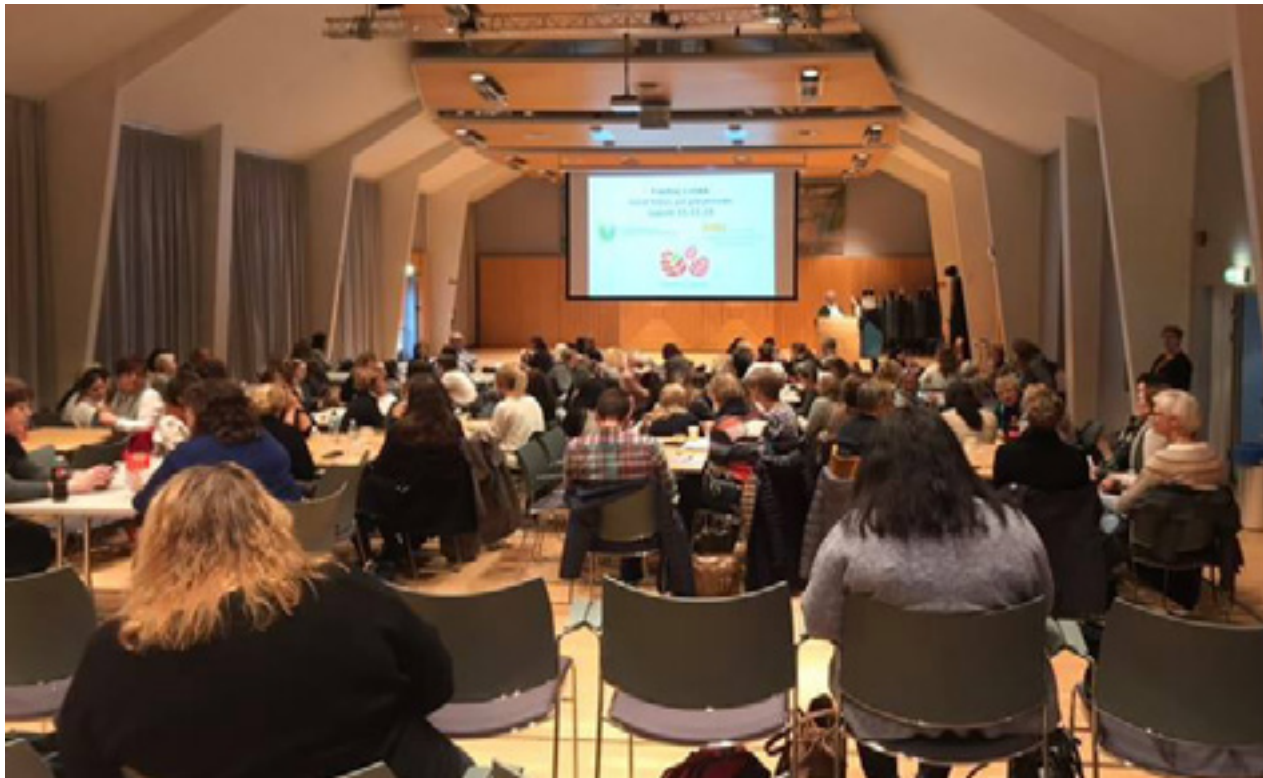
Samarbeid for etisk kompetanseheving arrangerte etikkdag i samarbeid med USHT Oppland.

Les mer om våre oppdrag i 2018 i vedlegg bakerst. Vi har valgt å inkludere etikkoppdrag de regionale veilederne har gjort i regi av sitt hovedarbeidssted for å synliggjøre synergieffekten for både Etikksatsingen og hovedarbeidsgiver. Disse er markert i blått og er ikke tatt med i tallene over.