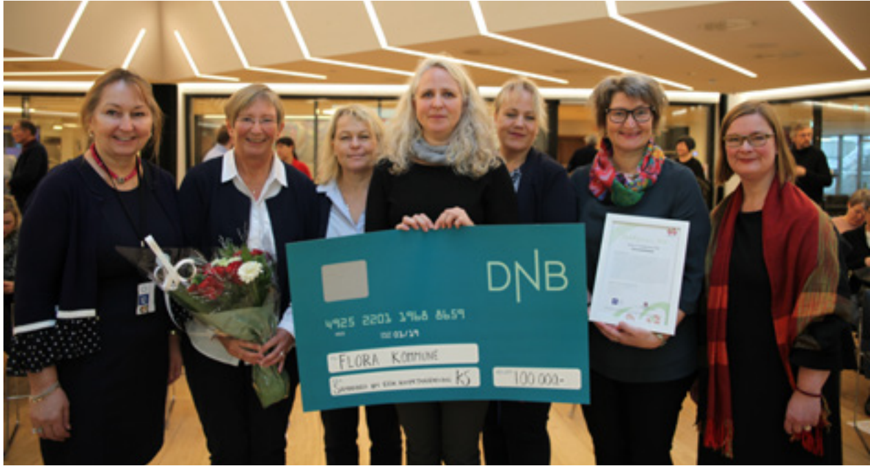
Årets vinner: Flora kommune.