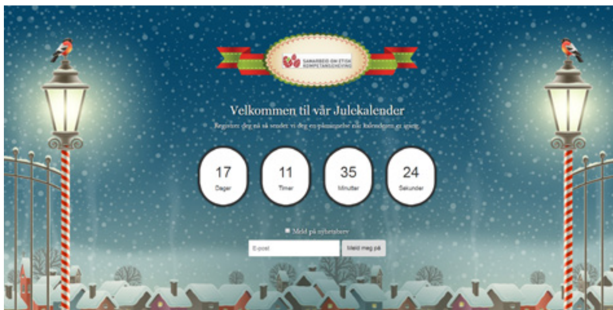
Screenshot av Etikkjulekalenderen 2018

Etikk – kalenderen er et populært verktøy som etterspørres fra kommunene i god tid før jul. Hver luke i kalenderen består av flere elementer som f. eks. en overskrift, et dilemma og en video/sang. I år hadde vi 754 forhåndspåmeldte deltagere, og nærmere 20 000 treff. Kalenderen brukes blant annet ute på tjenestestedene til en daglig etisk refleksjon sammen med kollegaer, og får veldig gode tilbakemeldinger om at den skaper entusiasme og bidrar til viktig etisk refleksjon i en hverdag i desember.