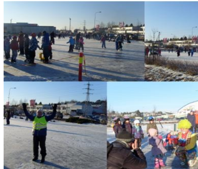
Lokalsamfunnsutvalg i Fredrikstad