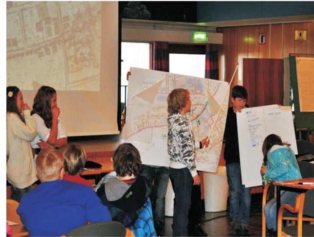
Plansmie i Rakkestad kommune