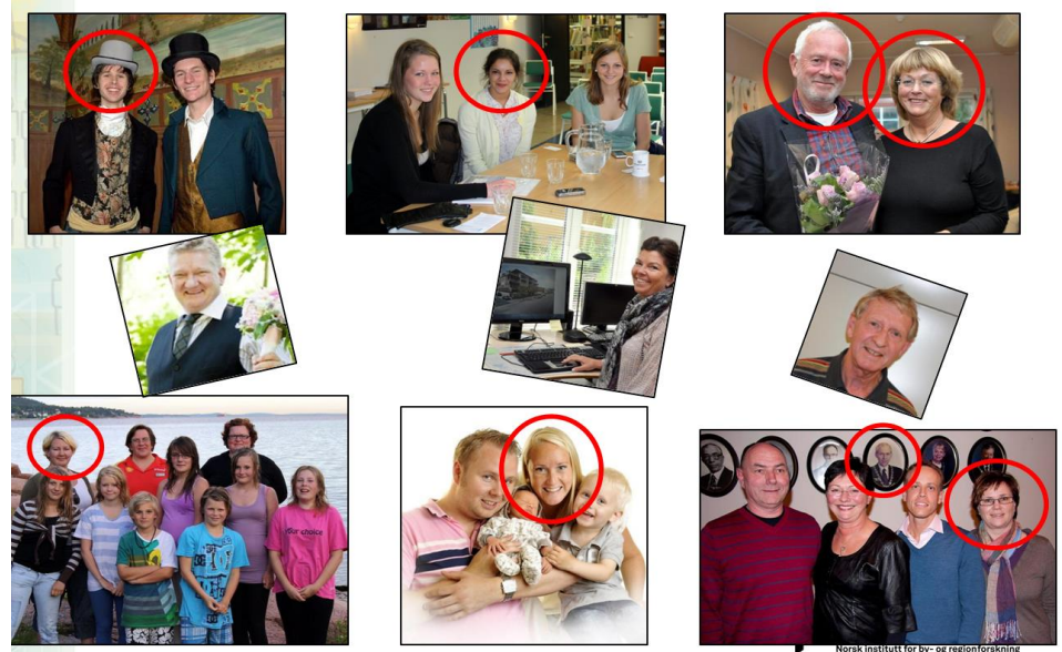
Noen av gjestebudsvertene

”Vi er alle klar for et nytt gjestebud nå arealplanen legges ut. Uavhengig om dere inviterer eller ikke” (gjestebudsvert)